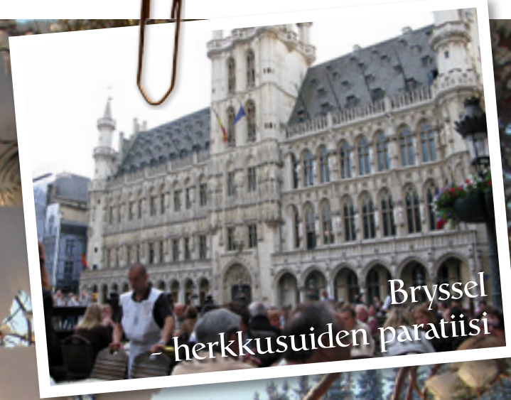
Bryssel - herkkusuiden paratiisi