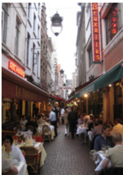
Keskustan pikkukadut ovat täynnä viehättäviä ravintoloita.