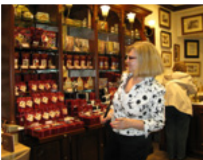
Merja suklaapuodin houkutuksissa.