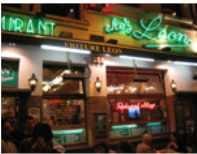
Ravintola Chez Léon on tunnettu hyvästä ruuastaan.