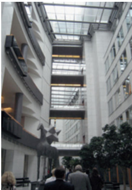
Euroopan parlamentin vaikuttava sisätila.

Euroopan parlamentin 736 jäsenen joukossa on 13 suomalaista meppiä. Äänestäjät EU:n 27 jäsenvaltiossa valitsevat