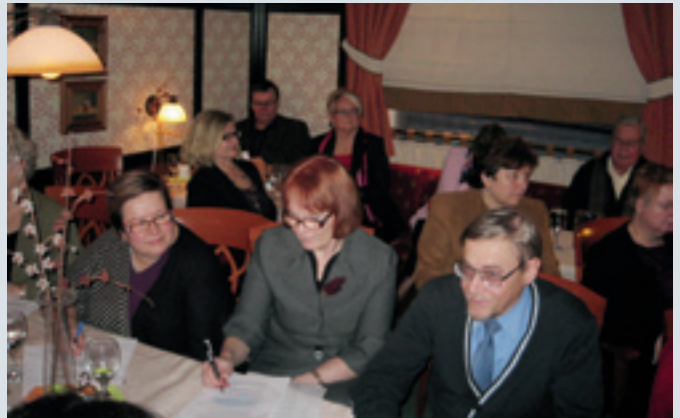
Syksyn liittokokous pidettiin Tampereella hotelli Cumulus Pinjassa.

H elsingin Merkonomien syysvuosikokous pidettiin 25. marraskuuta Suomen Liikemiesten kauppapistossa (HBC). Kokouksessa valittiin uudet hallituksen jäsenet erovuoroisten tilalle sekä hyväksyttiin vuoden 2010 toimintasuunnitelma ja entiseen jäsenmaksuun perustuva talousarvio. Yhdistyksen toimintasuunnitelma on luettavissa nettisivuillamme: www.helmeri.fi .