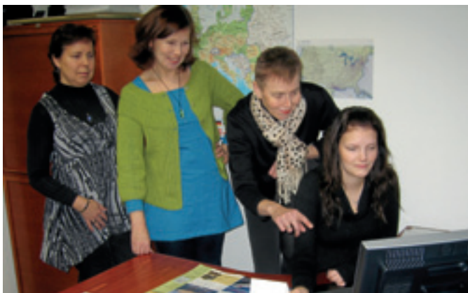
Matka-Agenttien Loviisan henkilökunta tutkii uutta Lomaleidit-sivustoa.

”Bella Toscana” – jo pelkkä ajatus kuvankauniista Toscanasta saa mielikuvituksen matkalle ihastuttavaan Italiaan. Lomaleidit tutustuvat näihin Italian varmasti viehättävimpiin maisemiin mm. jännittävällä vespasafarilla. Matkalla shoppaillaan tietysti myös hyväntasoisessa, monipuolisessa outlet-kylässä, vieraillaan antiikkimarkkinoilla ja tutustutaan herkulliseen italialaiseen keittiöön kokkikurssilla. Hyvää oloa haetaan myös kesäisellä Unkarin matkalla, pyöräilemällä, joogaamalla ja kävelemällä Balaton-järven alu-