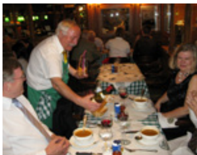
Chez Léonissa myös palvellaan hyvin.