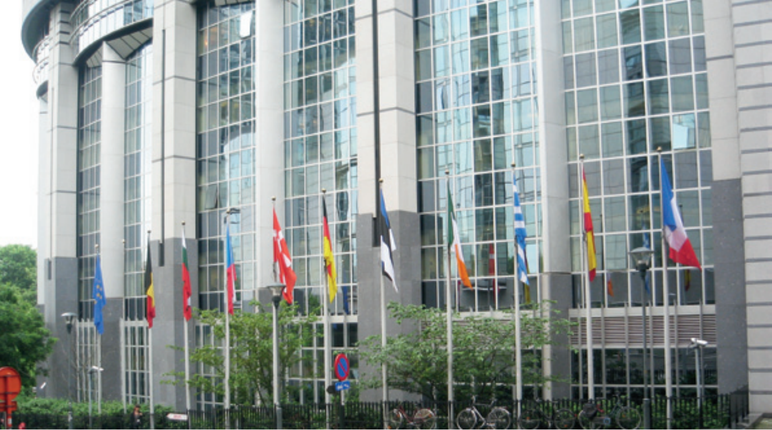
27 jäsenmaan lippurivistö koristaa Euroopan parlamenttia.