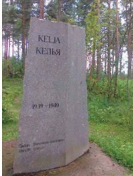
Keljan taistelun muistomerkki Sakkolassa Keljan kylässä.

Venäjän Karjalassa kävin kesän aikana kahdesti. Ensimmäisen sukuseuran kanssa teimme bussilla Laatokan kierroksen ja kävimme myös Vanhan Valamon luostarisaarella. Myöhemmin matkustimme vanhempieni synnyinseudulle Sakkolaan, josta käsin kiertelimme lähiseutuja. Niistä mat-