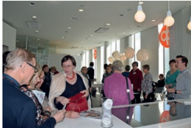
Asiakkaita palvelee pankki-, vakuutus- ja sijoitusasioissa pääsisäänkäynnin yhteydessä oleva konttori. Konttorissa ei käsitellä lainkaan käteistä.

konaan perinteiset työhuoneet. Ne on korvattu monitoimitiloilla, eikä suurimmalla osalla työntekijöistä ole pysyvää työpistettä. Työntekijät eivät edes mahtuisi yhtä aikaa työpaikalleen, jos kaikki tulisivat samaan aikaan töihin. Jättikonttoriin mahtuu työskentelemään yli 3 000 henkilöä.