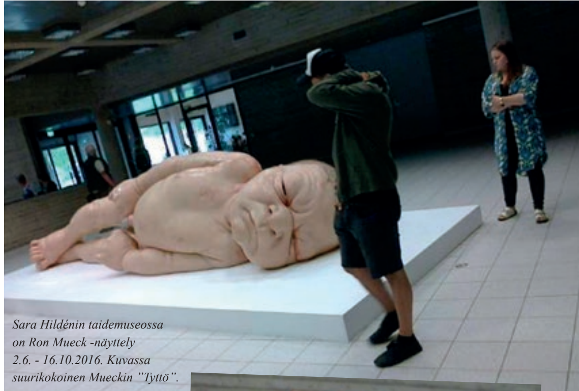
Sara Hildénin taidemuseossa on Ron Mueck -näyttely 2.6. - 16.10.2016. Kuvassa suurikokoinen Mueckin ”Tyttö”.

Tampereen suunnalle teimme kesäretken ystävättäreni kanssa. Ensin ohjelmassa oli tutustuminen Iitalan Naivistit-näyttelyyn. Ei yllätyksiä, sanoisinko perinteistä taidetta. Sitten vierailu Sara Hildénin taidemuseoon Tampereen Särkänniemessä. Museo sijaitsee upealla paikalla, toivottavasti pysyy jatkossakin siellä. Nyt taidemuseossa oli australialaisen Ron Mueckin näyttely. Todella vaikuttavia jätti- ja