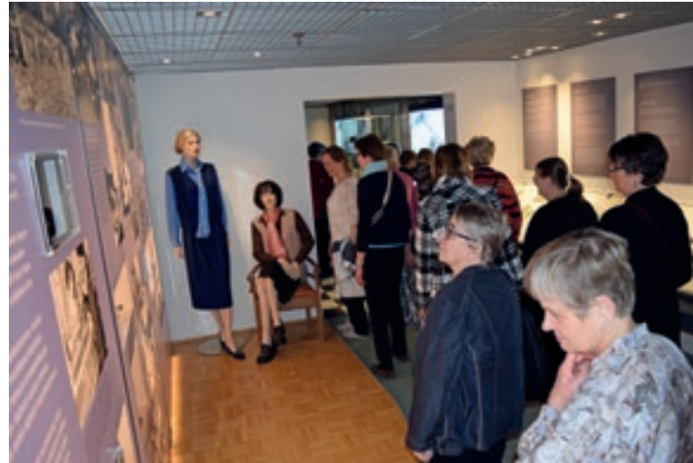
Pääsimme tutustumaan osuustoiminnan alkujuurille OP:n museossa. Kuvan työsäut ovat muuttuneet ajan saatossa vapaamuotoisemmaksi.