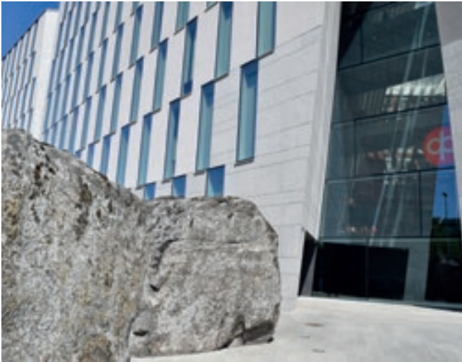
Gebhardinaukio 1. OP Ryhmän uuden toimistorakennuksen edessä jököttää kaksi valtavan suurta kivilohkaretta, ne on varta vasten kuljetettu paikalle Kuhmoisista.

kilöasiakkaille. Pankkikonttorissa voi kokeilla asuntoesittelyä virtuaalilaseilla.