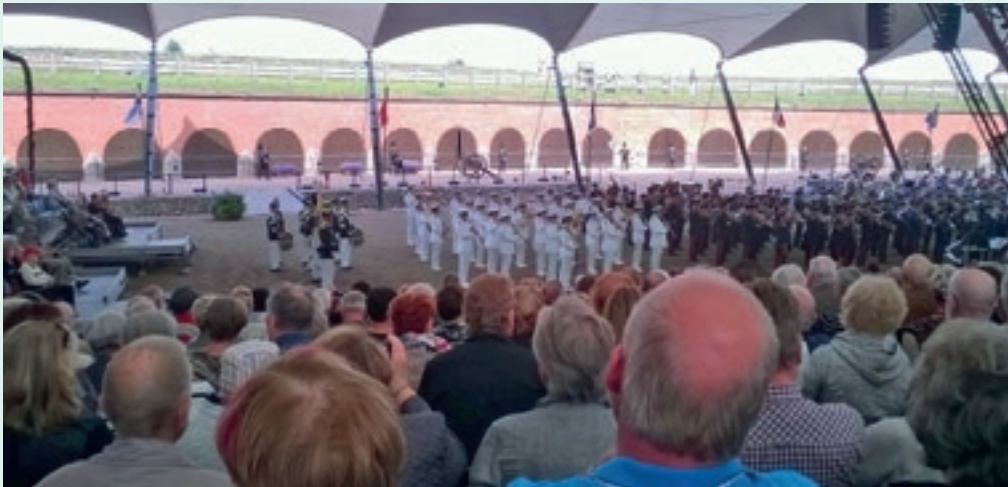
Hamina Tattoo järjestetään vanhan linnoituksen ympäröimässä Hamina Bastionissa.