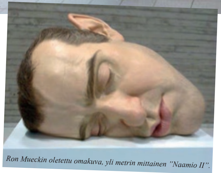
Ron Mueckin oletettu omakuva, yli metrin mittainen ”Naamio II”.

Seuraavana päivänä tutuimme uusittuun Lenin-museoon Tampereen työväentalolla, jonka salissa Lenin ja Stalin tapasivat vuonna 1905. Museo avattiin 1946. Neuvostoliiton hajottua se oli pitkään ainoa Lenin-museo, ainakin