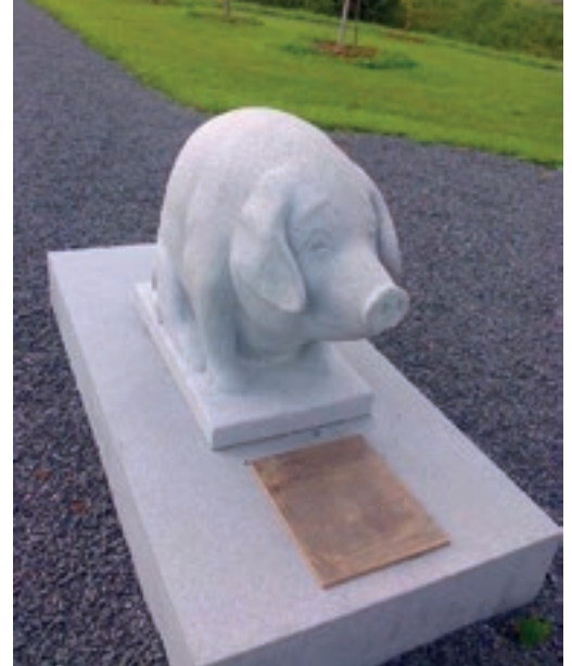
Sakkolan porsas on Lempäälän Evakkopuistossa.

Juupajoella järjestettyihin Sakkola-juhliin. Paluumatkalta pistäydyimme Lempäälän Evakkopuistossa katsomassa Sakkolan porsasta.