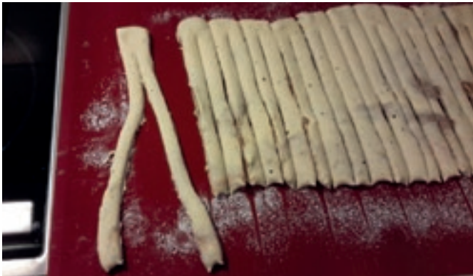
Tee paloihin syvät viillot.