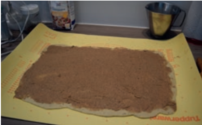
Levitä täyte taikinalevyille.