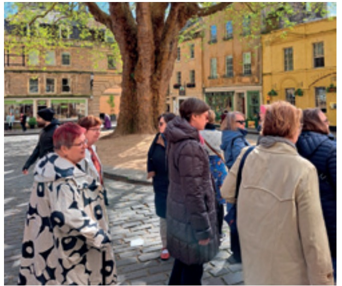
Tutustuimme muun muassa Jane Austenin kylpyläkaupunki Bathiin.