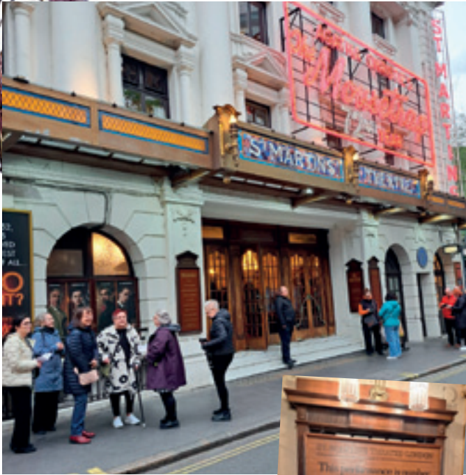
Lontoon West Endissä alkamassa Christien Hiirenloukku, jota on esitetty jo vuodesta 1952 - 29570. esitys!

Viidentoista osallistujan Helmeri-ryhmämme sai nauttia huhtikuun loppupuolella viiden päivän aikana niin