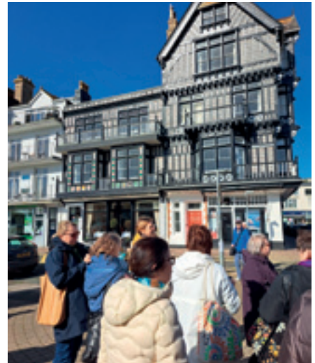
Dartmouthin kauniista pienestä merenrantakaupungista lähdimme vesibussilla Agathan kesätaloon Greenwayhin.