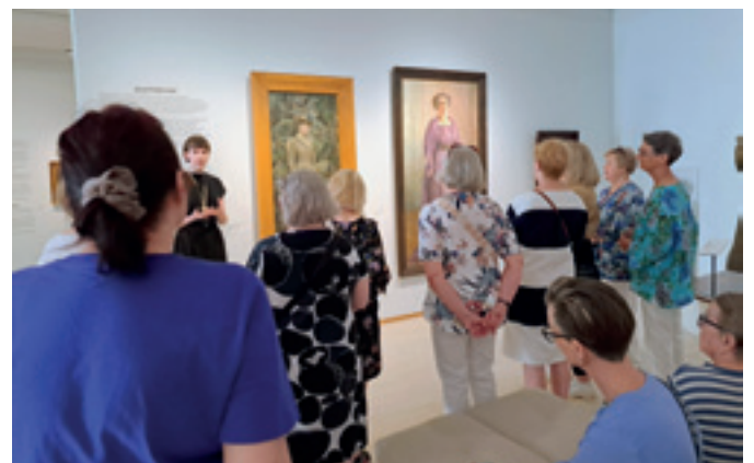
Ateneumin Eero Järnefelt -näyttelyssä oli esillä yli 200 teosta. Järnefeltin maisematauluissa on usein kuvattu Kolin luontoa.