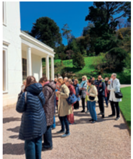
Laajan hienon puistoalueen ympäröimä komea Greenway House Devonissa on säilytetty sellaisena kuin se oli Agathan ja hänen miehensä aikana.