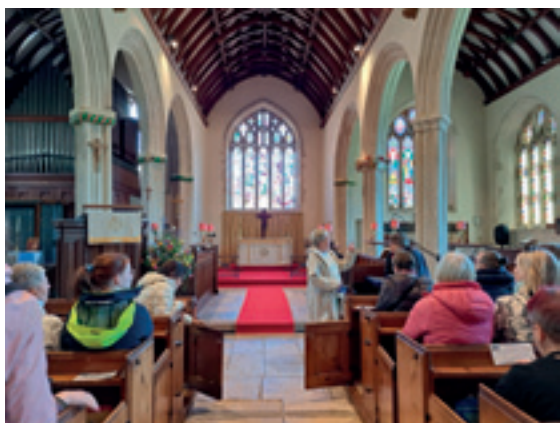
Kävimme myös Agathan kotikirkossa.