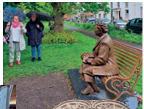
Agatha asui mm. Cholseyin kylässä, jossa hänen patsaansa puiston penkillä tervehti meitä.