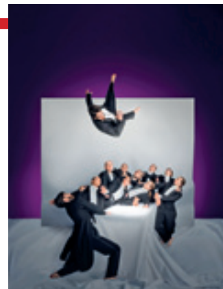
Kuva: HKT, Silence, kuva Petra Tiihonen