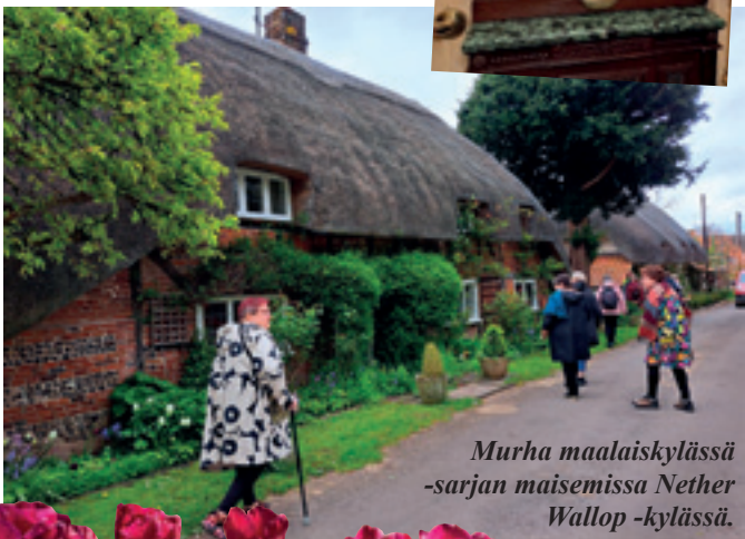
Murha maalaiskylässä -sarjan maisemissa Nether Wallop -kylässä.