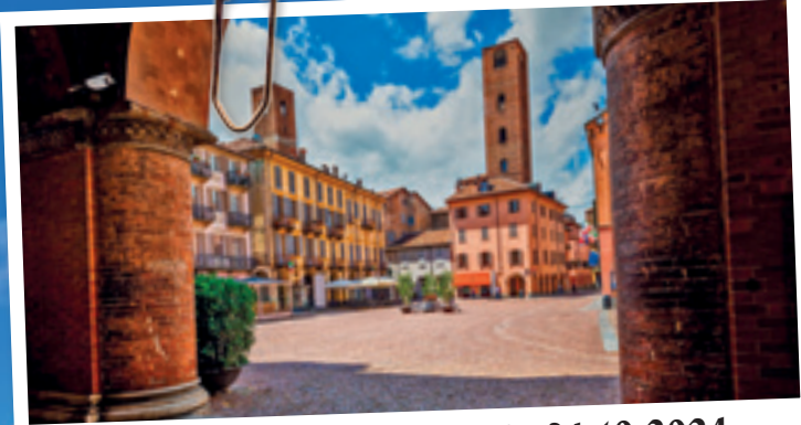
Makumatka Italiaan 20.-24.10.2024