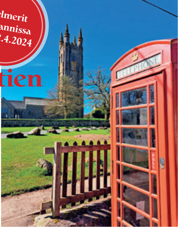
Kiertelimme keväisessä Englannissa Agatha Christien jalanjäljissä niin suurissa kaupungeissa kuin pienissä kylissäkin (kuvassa Widecompin kirkonkylä).